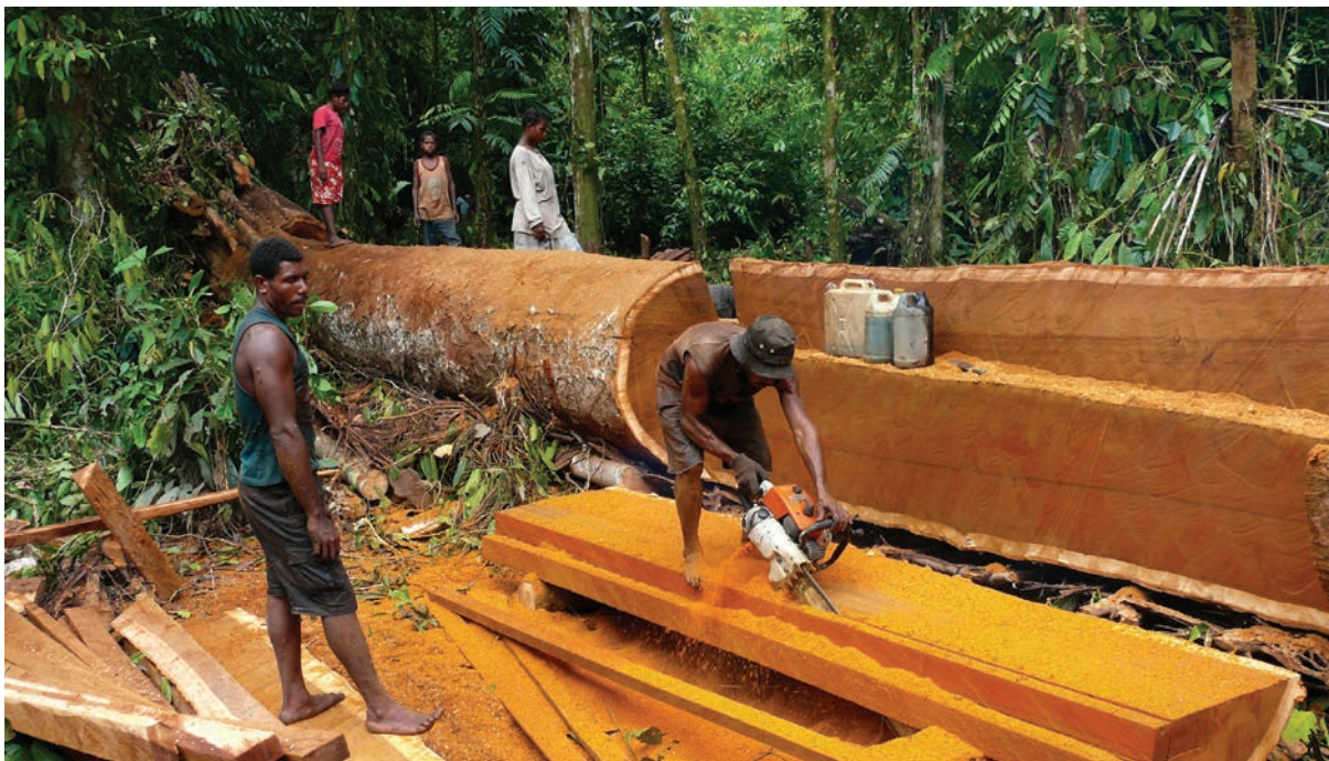
Un villageois découpe un arbre abattu en planches. Papouasie, Indonésie.

Les TLAS pourraient contribuer au respect des exigences du RDUE en matière de diligence raisonnée, bien qu'il convient d'indiquer que le Règlement stipule que le bois autorisé dans le cadre du FLEGT sera reconnu comme preuve de légalité et non pas comme preuve de son statut « zéro déforestation ». Cela signifie qu'à l'heure actuelle, les autorisations FLEGT ne garantissent pas que tous les produits du bois concernés sont « zéro déforestation ».