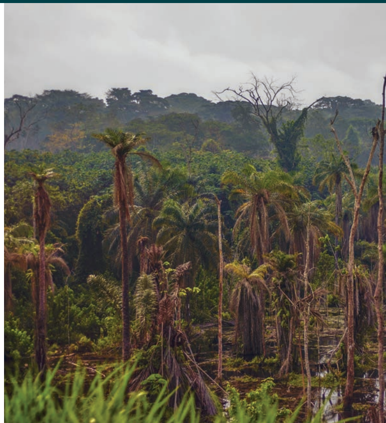
Forêt tropicale en Afrique du Centre.

Le RDUE affaiblira les mesures incitatives pour les autorisations FLEGT, à moins que ces dernières puissent être modifiées de façon à garantir que les produits concernés sont « zéro déforestation ». Toutefois, l'UE n'est pas le principal marché d'exportation du bois provenant de beaucoup de ces pays, et cette question risque d'être de